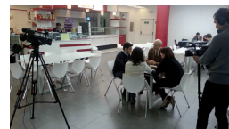
La registrazione di una puntata di «Social Talk» di un bar. La trasmissione sarà anche condivisa attraverso i profili sociali della trasmissione stessa.