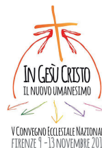
V CONVEGNO ECCLESIALE NAZIONALE FIRENZE 9-13 NOVEMBRE 2015

Quest'anno la festa di san Francesco di Sales, che tradizionalmente vede la pubblicazione del messaggio del Papa per la Giornata mondiale delle comunicazioni sociali, si arricchisce di un nuovo evento: il 23 gennaio, giorno che precede il 24 gennaio, il santo patrono dei giornalisti, sarà lanciato all'indirizzo www.firenze2015.it il nuovo sito web del quinto Convegno ecclesiale nazionale.