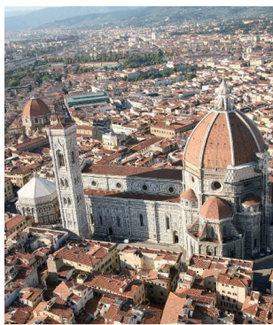
Il centro di Firenze con il Duomo di Santa Maria del Fiore