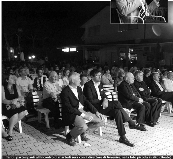
Tanti i partecipanti all'incontro di martedì sera con il direttore di Avvenire, nella foto piccola in alto (Boato)