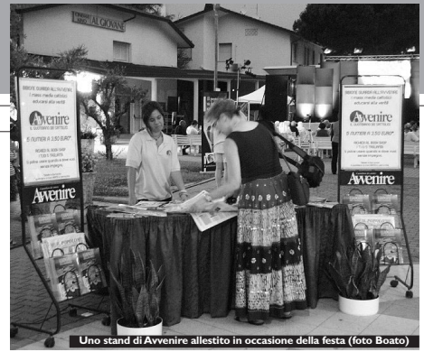
Uno stand di Avvenire allestito in occasione della festa