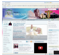
Il sito nuovo e la presenza su Facebook e Twitter mostrano una diocesi che viaggia al passo col Web