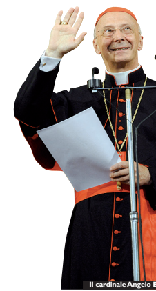
Il cardinale Angelo Bagnasco