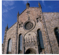
Dalla pagina scritta al web il Duomo «incontras» fedeli e turisti. Coletti: comunicare bene e comunicare il bene

DA COMO ENRICA LATTANZI Domenica scorsa nella diocesi si è svolta la Giornata del quotidiano, appuntamento fisso da anni per le numerose comunità parrocchiali. Fra queste anche la Cattedrale, dove lo scorso fine settimana una speciale attenzione è stata riservata non solo ad «Avvenire» ma anche al «Settimanale» diocesano, in occasione delle ordinazioni presbiterali di sabato. «Siamo convinti sia indispensabile sostenere e contribuire a diffondere un certo modo di fare informazione», affermano i canonici del Capitolo del Duomo dove da alcuni mesi si sta portando avanti un progetto di sensibilizzazione proprio sul fronte