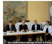
La conferenza stampa di ieri a Carpi