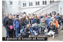
giovani di Lonato ad Assisi