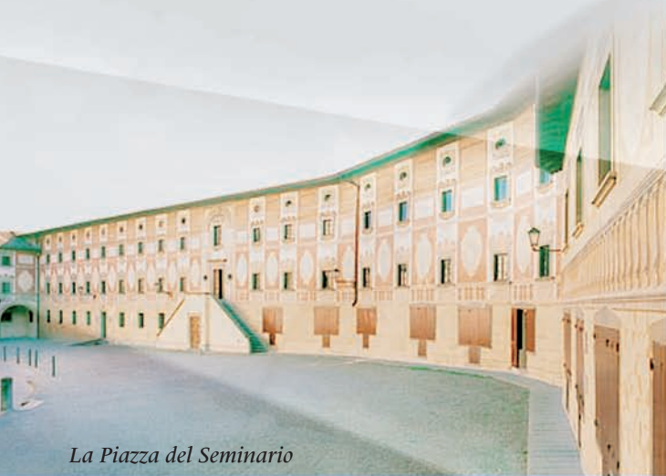
La Piazza del Seminario

Da sempre il teatro dà voce alla domanda di senso che interroga l'uomo di fronte alle speranze e alla fragilità del vivere, alla fatica della malattia, all'angoscia della morte. Oggi più che mai, il teatro si offre come strumento di comunicazione del vissuto religioso e dell'esperienza spirituale profonda: dall'appartenenza a una comunità alle espressioni popolari della fede, dalla liturgia alla preghiera fino all'intuizione mistica. Una spiritualità incarnata, capace di rispondere a un sempre più diffuso bisogno di silenzio e di autenticità. Sulla scia del successo de I Teatri del Sacro , l'appuntamento di San Miniato è l'occasione per una riflessione che sia frutto del vivo incontro tra l'arte teatrale e l'esperienza del sacro, in un faccia a faccia tra artisti, teologi, studiosi e quanti si occupano di cultura nella comunità cristiana.