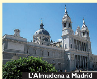
L'Almudena a Madrid