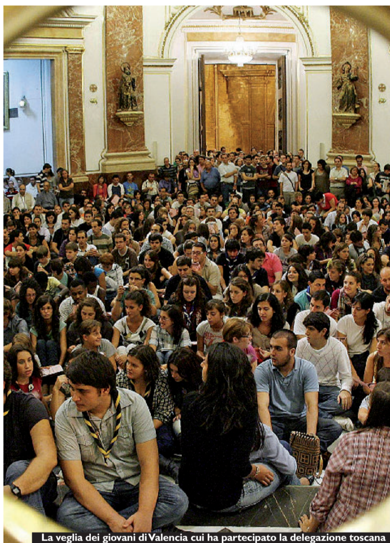
La veglia dei giovani di Valencia cui ha partecipato la delegazione toscana