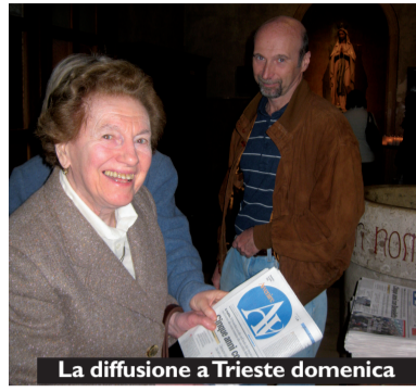
La diffusione a Trieste domenica

Incoraggiante la risposta nelle parrocchie all'inserimento di 4 pagine sul Friuli Venezia Giulia domenica scorsa con Avvenire