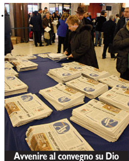
Avvenire al convegno su Dio